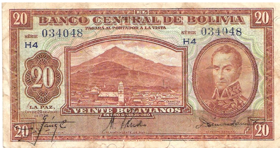
Foto 1. Anverso de papel moneda, Banco Central de Bolivia.

La utilización del emblema del Cerro del Potosí, apareció en diversos especímenes de papel moneda, entre los que podemos mencionar al billete producido por el Banco Central de Bolivia en el año de 1928, con valor de 20 bolivianos, en oro o giros-oro. La ley que ampara la emisión de los billetes se promulgó en La Paz, con fecha del 20 de Julio de 1928.