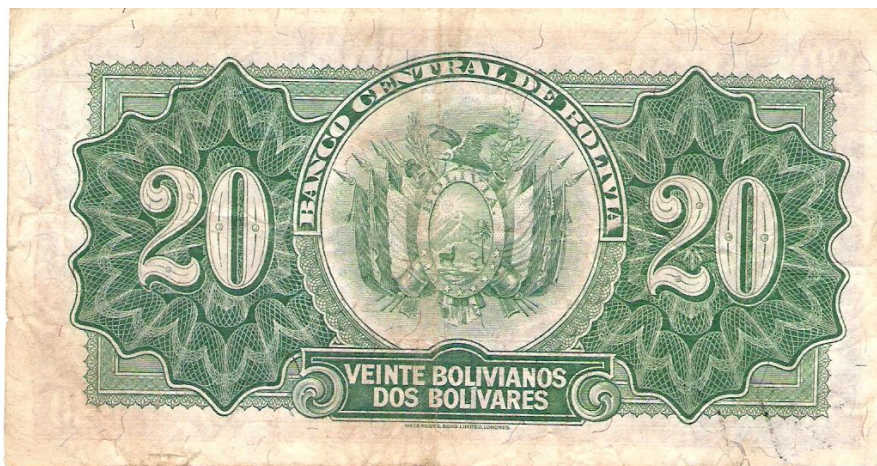
Foto 2. Reverso de papel moneda, Banco Central de Bolivia.

El anverso del billete está compuesto al centro por un grabado central de un paisaje urbano con el fondo del Cerro de Potosí (deducimos que representa a la ciudad hermana de Potosí, Bolivia) al lado derecho de la imagen se encuentra otro grabado con el rostro de Simón Bolívar, enmarcado en óvalo. Al lado izquierdo del grabado central se encuentra el número 20.