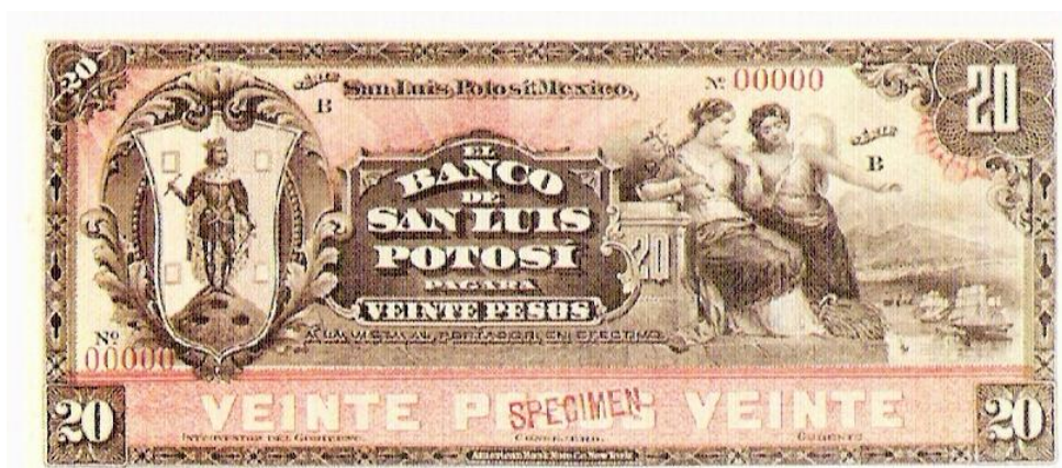
Foto 3. Anverso de papel moneda, Banco de San Luis Potosí. Presentado en Cien años de la Banca Potosina .

Uno de los primeros billetes emitidos por el Banco de San Luis Potosí, cuenta con la siguiente descripción, al centro la leyenda El Banco de San Luis Potosí , pagará veinte pesos. Del lado izquierdo la imagen de San Luis rey de Francia sobre el Cerro de San Pedro con tres bocaminas, enmarcado en una rocalla. Del lado derecho se encuentran dos imágenes femeninas, una representa la alegoría del comercio, porta en su mano el caduceo; y la otra señala a la bahía donde están anclados los barcos de vela, con quien se pretende realizar el comercio internacional, su color es rosa con gris. El reverso tiene al centro el águila porfiriana con la serpiente en su pico, debajo de ella un festón semicircular, y a los costados los números veinte. Abajo se encuentra la leyenda Banco de San Luis Potosí , y con letras más pequeñas el pie de imprenta American Bank Nute Company, New York.