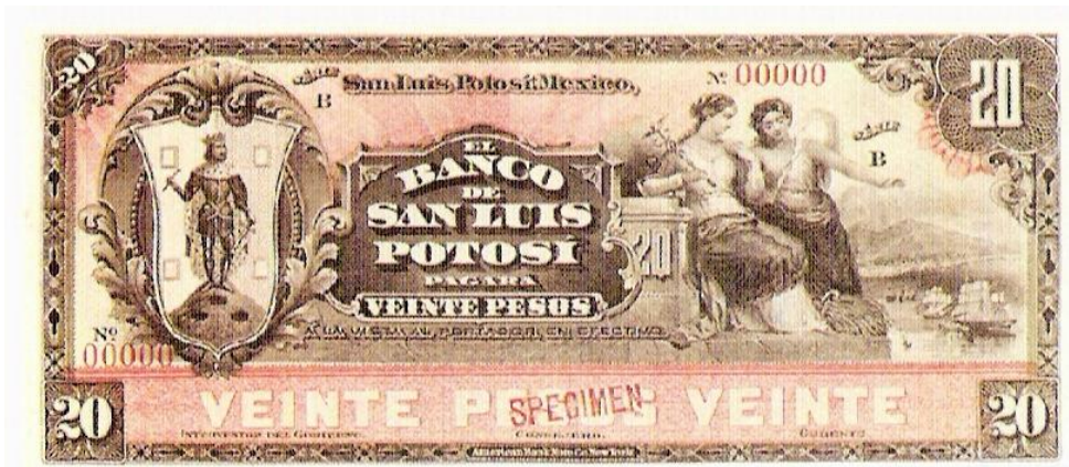
Foto 3. Anverso de papel moneda, Banco de San Luis Potosí. Presentado en Cien años de la Banca Potosina .

Uno de los primeros billetes emitidos por el Banco de San Luis Potosí, cuenta con la siguiente descripción, al centro la leyenda El Banco de San Luis Potosí , pagará veinte pesos. Del lado izquierdo la imagen de San Luis rey de Francia sobre el Cerro de San Pedro con tres bocaminas, enmarcado en una rocalla. Del lado derecho se encuentran dos imágenes femeninas, una representa la alegoría del comercio, porta en su mano el caduceo; y la otra señala a la bahía donde están anclados los barcos de vela, con quien se pretende realizar el comercio internacional, su color es rosa con gris. El reverso tiene al centro el águila porfiriana con la serpiente en su pico, debajo de ella un festón semicircular, y a los costados los números veinte. Abajo se encuentra la leyenda Banco de San Luis Potosí , y con letras más pequeñas el pie de imprenta American Bank Nute Company, New York.