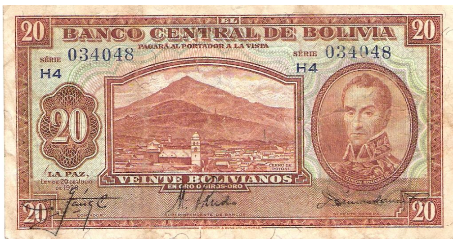
Foto 1. Anverso de papel moneda, Banco Central de Bolivia.

La utilización del emblema del Cerro del Potosí, apareció en diversos especímenes de papel moneda, entre los que podemos mencionar al billete producido por el Banco Central de Bolivia en el año de 1928, con valor de 20 bolivianos, en oro o giros-oro. La ley que ampara la emisión de los billetes se promulgó en La Paz, con fecha del 20 de Julio de 1928.